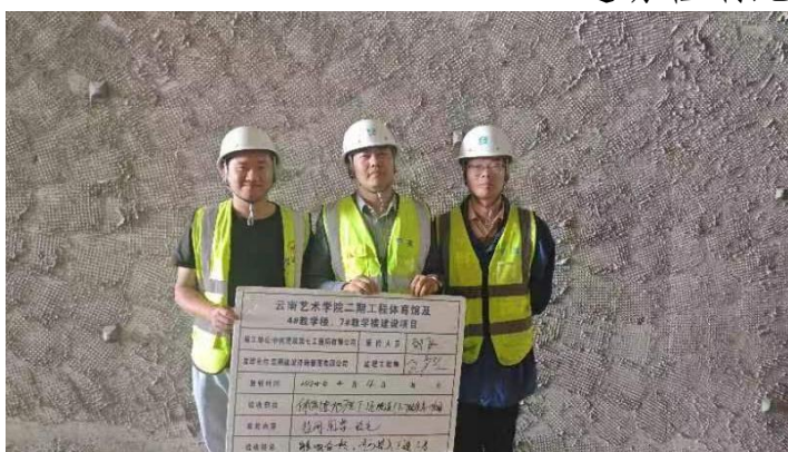
落实现场三检制度