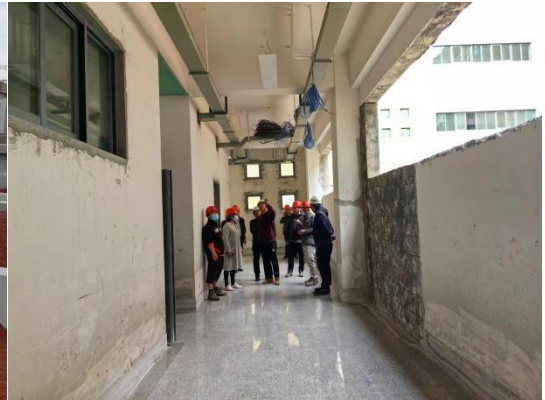
施工完成区域样板检查