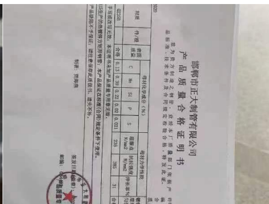
进场轻钢龙骨验收