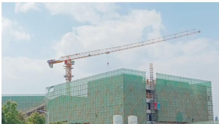
剧场音乐厅（1#2#教学楼）

1. 艺术实践中心（1#2#3#教学楼），剧场音乐厅综合楼（1#2#教学楼）内墙抹灰完成，18.6m屋面第二道防水施工完成、蓄水完成；楼梯间管内穿线完成95%，一至五层水平喷淋管道安装完成60%，地下室（消火栓+喷淋）主管安装60%，雨水立管安装90%。美术实训用房（3#教学楼）电影院、办公区、服务中心外墙抹灰完成，内墙抹灰完成；通风管道穿墙洞口修补80%，室内卫生间排水管支管安装完成10%，强弱电桥架安装40%。5#教学楼水磨石精磨完成，外墙真石漆施工完成90%，吸音墙裙面板安装完成90%；地胶地面自流平施工完成80%，吊顶顶棚腻子施工完成，内墙涂料施工完成80%，室外消火栓管道安装已完成。6#教学楼A区：水磨石精磨完成95%，卫生间地砖粘贴完成内墙涂料喷涂完成90%，门安装完成，窗玻璃安装完成80%，外墙真石漆喷涂完成90%，外墙装饰铝方通骨架安装完成。B区：内墙涂料喷涂完成90%，水磨石精磨完成95%，门安装完成，窗玻璃安装完成80%，外墙真石漆喷涂完成90%，外墙水泥板装饰预埋板及骨架安装完成90%。C区水磨石精磨完成95%；卫生间墙地砖粘贴完成，门安装完成，窗玻璃安装完成80%，内墙涂料喷涂完成80%，一层屋面花池种植覆土完成，室外散水沟垫层浇筑完成，散水沟砌筑完成80%。