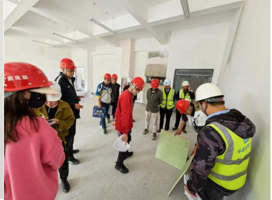
组织认质认样工作