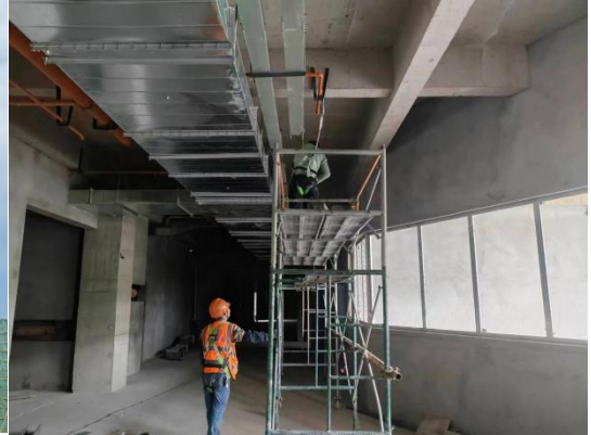
美术实训用房（3#教学楼）