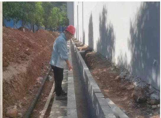
安全检查日常巡检