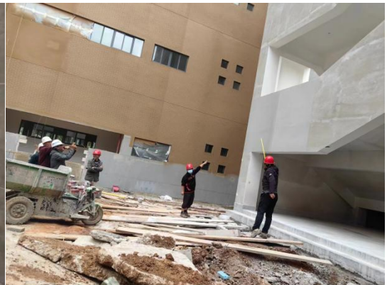
施工完成区域样板检查