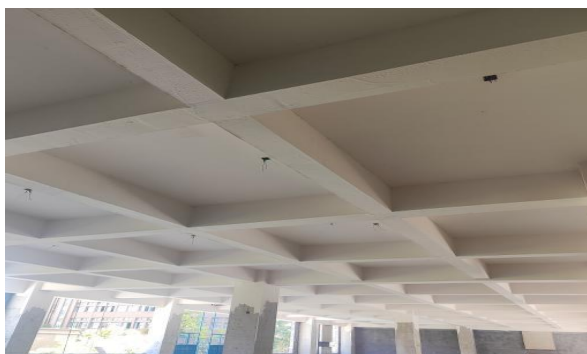
天棚第一遍腻子刮白本周完成30%