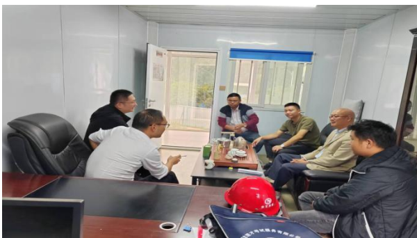
现场进度推进座谈