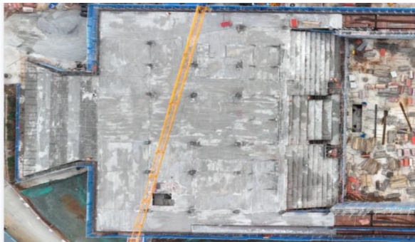
体育馆 T-3混凝土浇筑完成