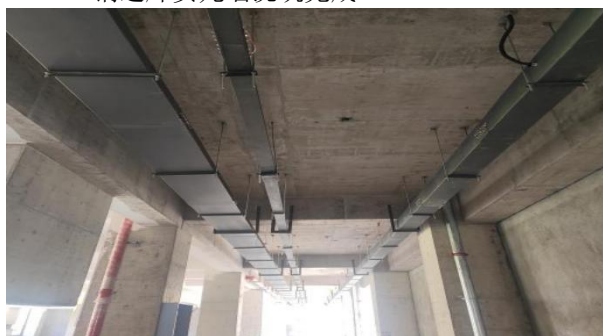
桥架及穿线安装完成