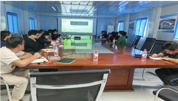
图纸二次深化设计现场答疑