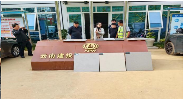
地砖现场初步认样