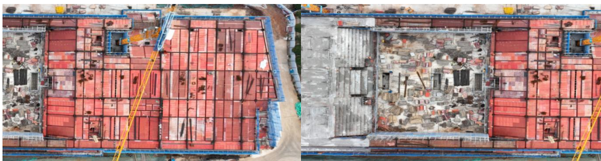
体育馆T-1区一层模板施工完成

2. 由于由于施工方自身原因，本周体育馆及7#教学楼施工人员不足，现场有改观但建设工程进度仍滞后。体育馆T-1区一层模板施工完成；T-2区一层钢筋绑扎完成；T-3区一层混凝土浇筑完成。4#教学楼内墙抹灰收尾完成，外墙抹灰收尾完成，4-2区外架拆除完成；天棚第一遍本周刮白完成30%，累计完成90%；水磨石样板完成，水磨石找平层完成30%；吊顶样板完成；钢结构女儿墙浇筑完成；屋面挤塑聚苯板完成，找平层浇筑完成；机电桥架安装完成，灯线及开关线穿线完成，雨落管安装完成，消防桥架样板完成；风管安装本周完成20%，累计完成80%。7#教学楼7-1区四层支模架完成，钢筋绑扎完成20%；7-2区支模架、钢筋绑扎完成；7-3区四层支模架完成40%；7-4西区二层钢筋绑扎完成；7-4东区三层支模架完成，钢筋绑扎完成20%；7-5西区一层浇筑完成；7-5东区三层浇筑完成。