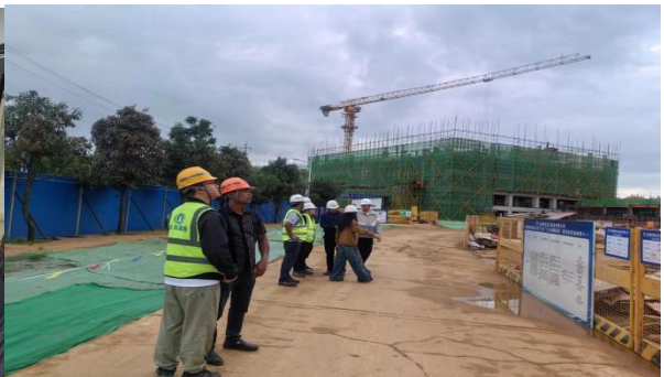
呈贡区质量安全监督站现场检查