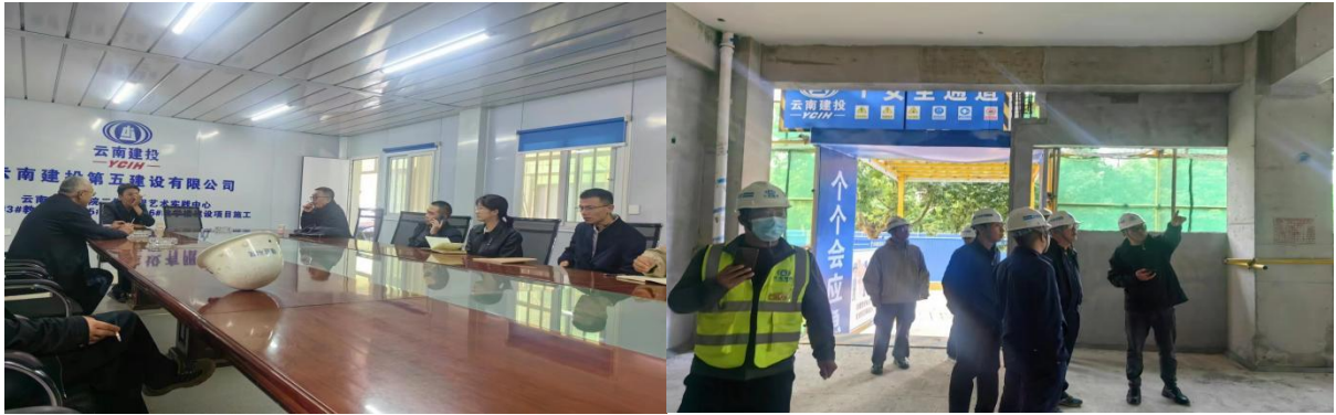
建筑协会专家创优工作现场指导