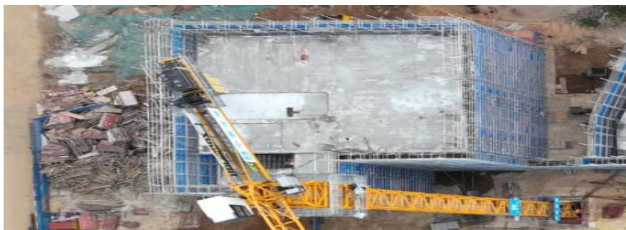
7#教学楼7-5区东区一层浇筑完成