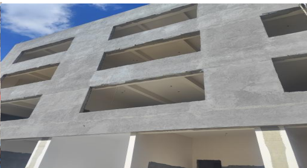
4#教学楼 外墙抹灰收尾