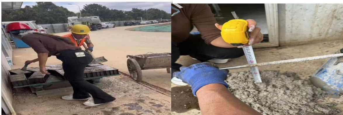
抽检现场混凝土试块及坍落度检测