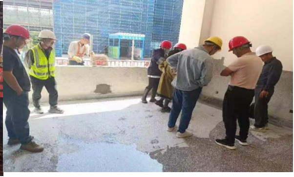
现场水磨石样板验收