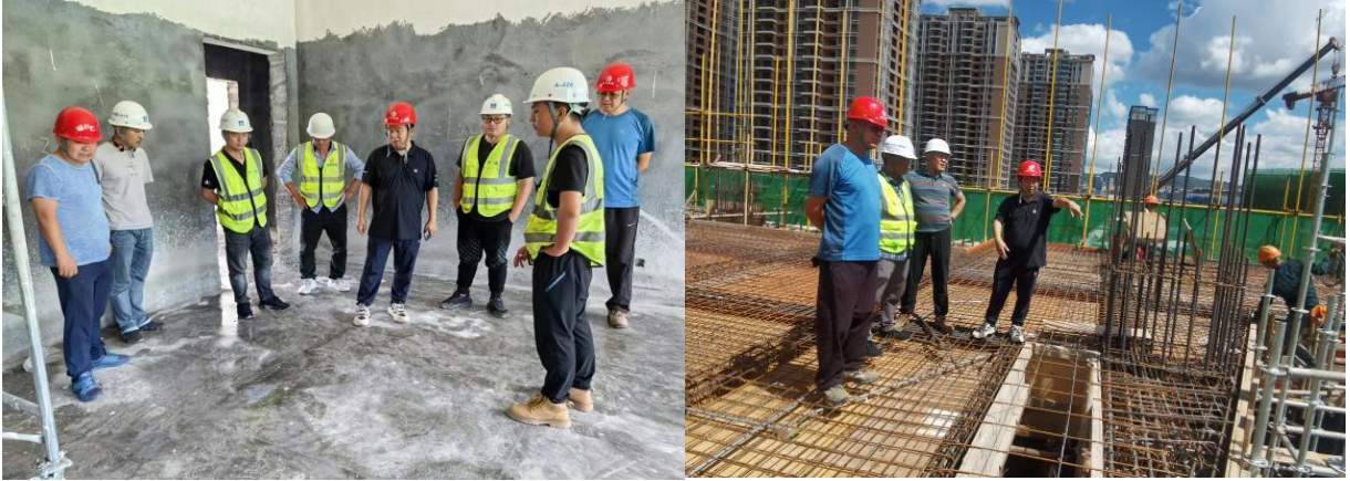
指挥长实地检查项目进展情况