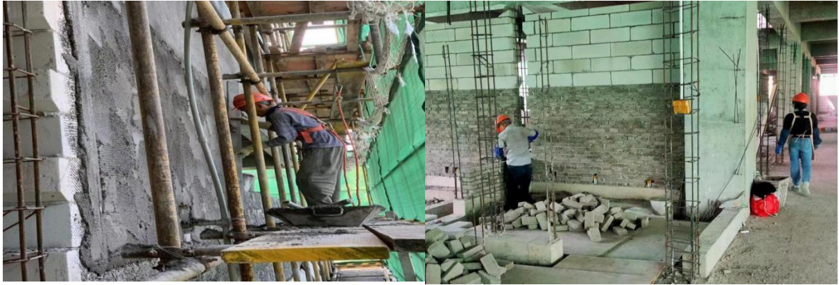
5#教学楼 D区外墙面抹灰