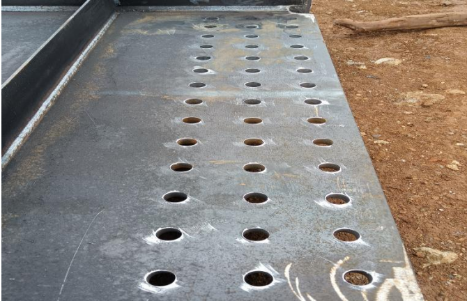
现场钢构栓孔抽检