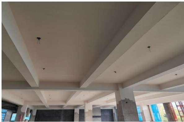
4#教学楼二、三层天棚第一遍腻子完成，四层完成30%