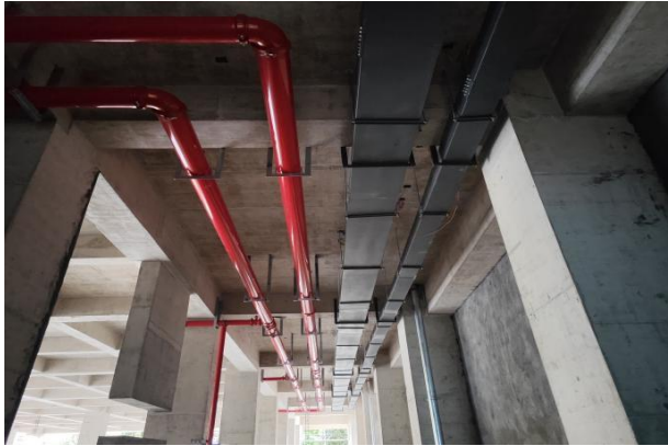
4#教学楼一-三层桥架安装完成