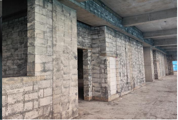
4#教学楼五层内墙基层、挂网、拉毛完成;