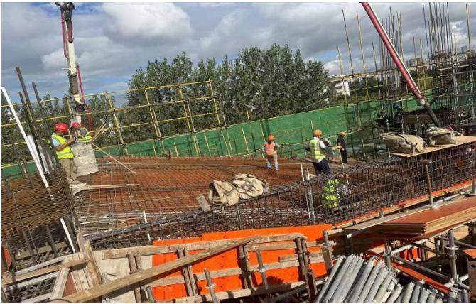
现场浇筑过程检查