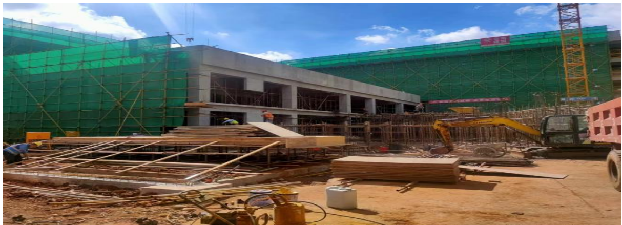
6#教学楼C区室外楼梯模板支架及模板安装

2. 由于施工方自身原因，本周体育馆建设工作停滞；4#教学楼进展不大，水磨石样板大面完成；7#教学楼仅有零星施工，大部分作业面停滞。