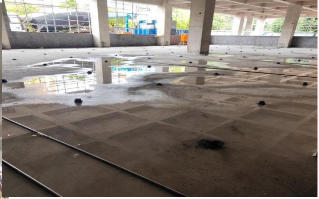
4#教学楼一层防潮层施工完成30%