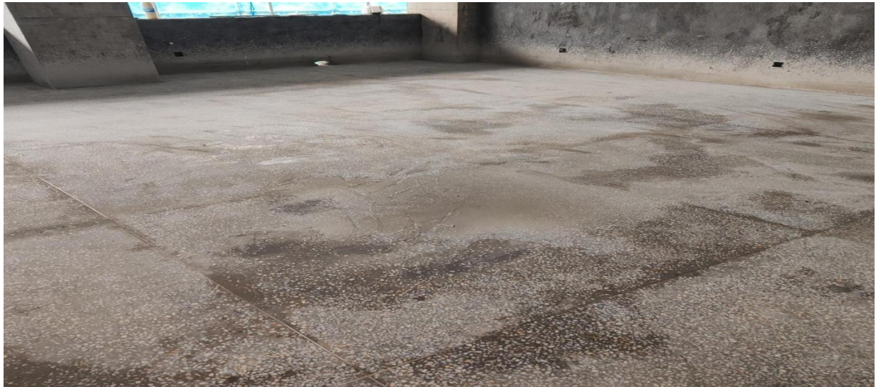
4#教学楼水磨石样板大面积已完成